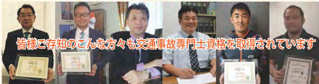
衆議院議員 元文科大臣 塩谷 立 様

NPO 法人ジコサポ沖縄支部（心身堂鍼灸・整骨院 新都心院内）☎098-868-1125